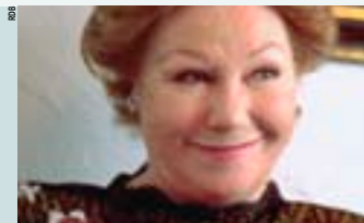
Nadine de Rothschild